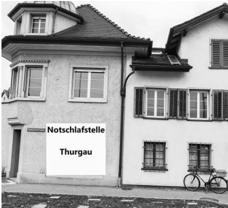
Die Notschlafstelle in Weinfelden ist seit Ende 2019 in Betrieb.

Am 3. November wurde in Weinfelden ein Verein gegründet, dessen Zweck es ist, Menschen in Not ein kurzfristiges und unbürokratisches Obdach anzubieten.