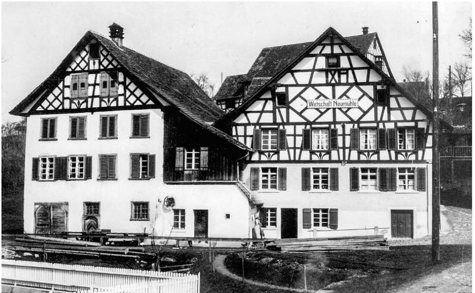
Die Neumühle bei Hüttwilen, 1932.